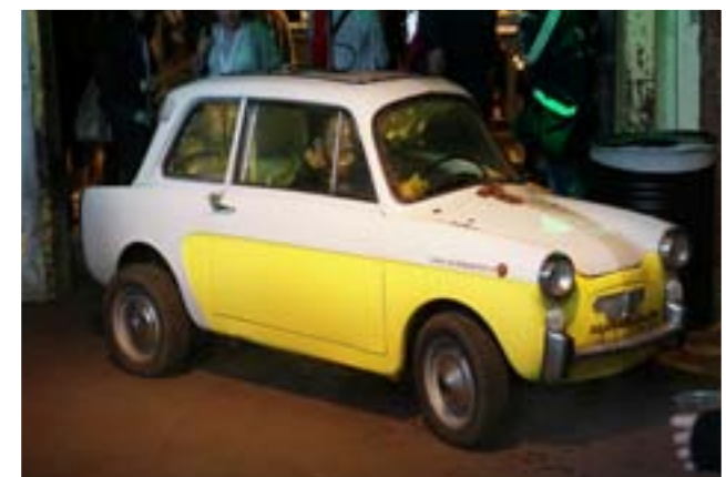
▲ De Scubabianchi, een auto als aquarium