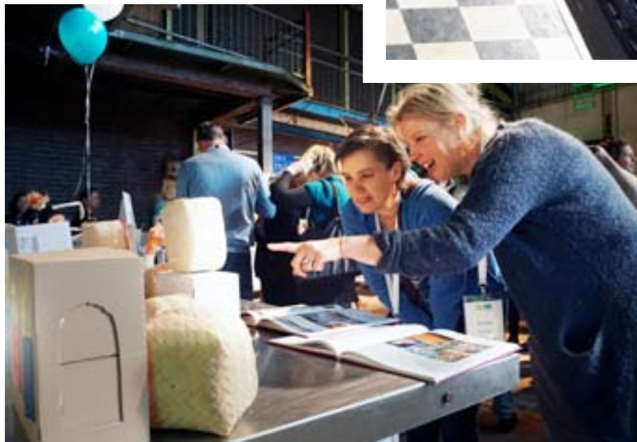
◀ Presentaties van scholen