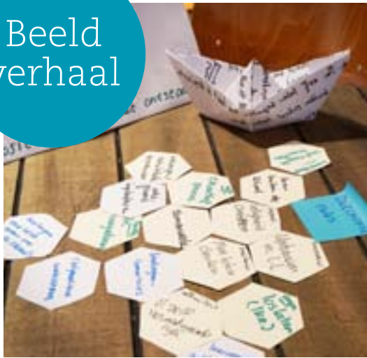
◀ Designworkshop pedagogisch klimaat en 21 st century skills