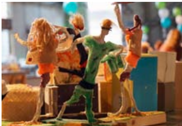
▲ Presentaties van scholen