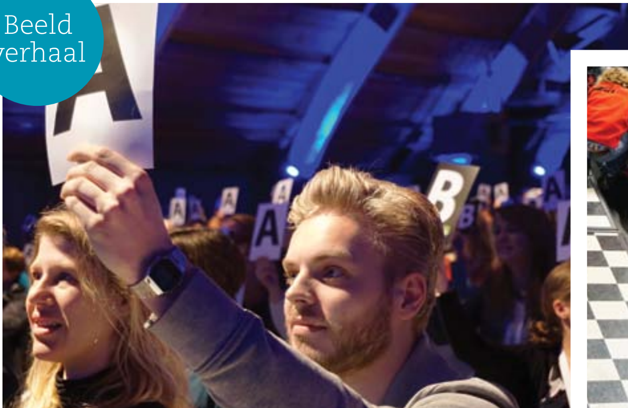
◀ Afsluitende quiz door DNL-theatercollectief