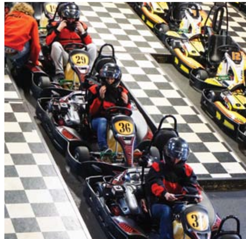
▲ Leraren kunnen karten!